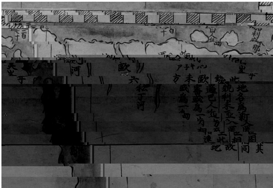
图 N 利玛窦坤輿万国全图 新入匿